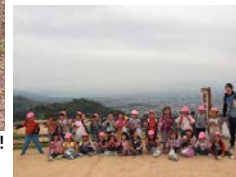
「みんな、よく頑張ったね」