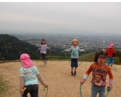
山の上でも縄跳び・・・